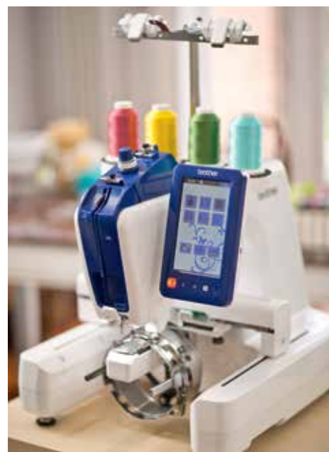
Приспособление для вышивания на бейсболках приобретает отдельно

LED указка для позиционирования помогает достичь идеального положения иглы, показывая точное место, куда она опустится.