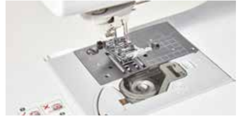
Entraînement à 7 griffes