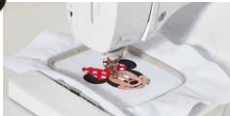
Champ de broderie de 100 x 100 mm