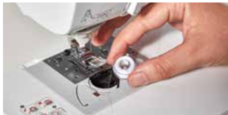
Mise en place rapide de la canette