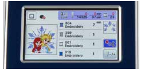
Écran tactile couleur LCD 9,4 cm