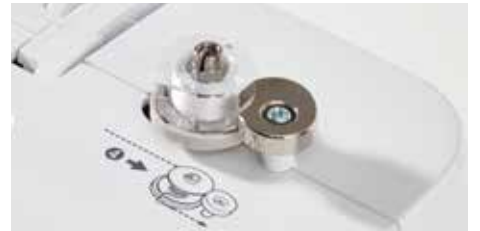
Système de remplissage de la canette