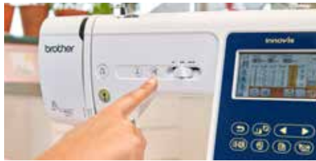
Commandes à portée de main