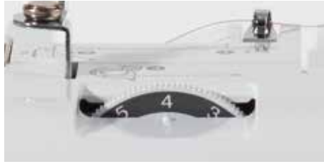
Réglage de la tension du fil