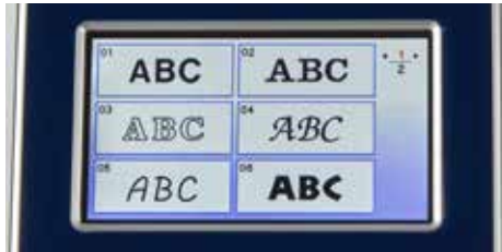
Styles de polices de caractères intégrés