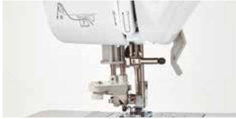
Système d'enfilage de l'aiguille avancé