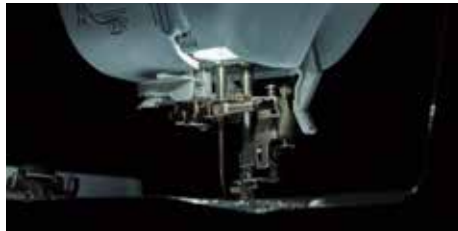
Éclairage LED super lumineux