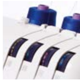
Guide d'enfilage avec repères en 4 couleurs