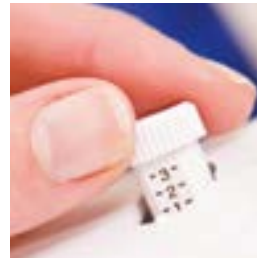
Contrôle de la pression du pied presseur