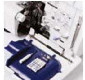
Rangement astucieux des accessoires