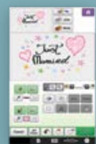
Zet het om