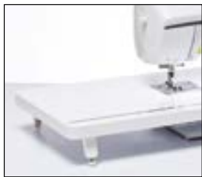
Table d'extension extra-large

Agrandissez votre plan de travail avec cette table d'extension extra-large. Idéale pour les ouvrages de quilting et de couture de grande taille. La table dispose d'une règle et d'un espace de rangement pour votre genouillère.