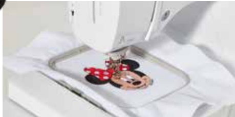
Stickfläche von 100 x 100 mm